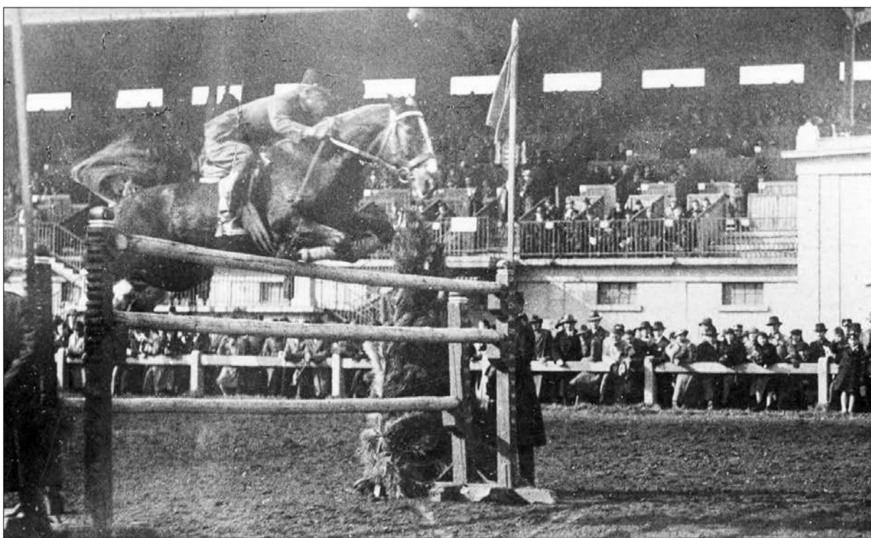
Bodó Imre verseny közben